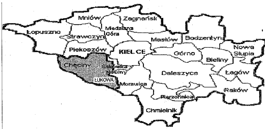
Mapa: lokalizacja Łukowa w układzie powiatu kieleckiego

Powierzchnia miejscowości – Łukowa zajmuje 7,93 km 2 .